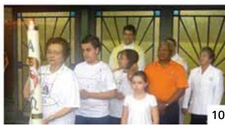
Fotos 1 e 2: Café da Acolhida / Fotos 2 e 4: Coroação de Nossa Senhora / Foto 05: Missa do dia da mães / Foto 06: Missa da família na Escola Estadual Anita Brina Brandão / Fotos 7 e 8: Missa de cura e libertação / Foto 9: Grupo de oração / Foto 10: Missa dos 59 anos das equipes de Nossa Senhora no Brasil.