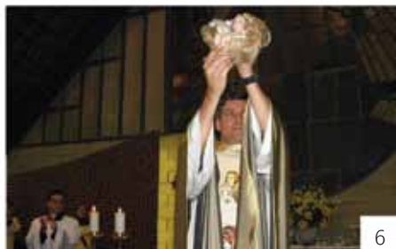
01 - Missa do Advento | 02 - Festival de tortas e bingo da Pastoral da Acolhida 03 - Coroação de Nossa Senhora - Terço dos Homens | 04 - Natal das crianças - Pastoral da Família e Mater Crucis | 05 e 06 - Missa de Natal